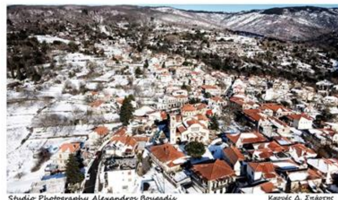
Studio Photography Alexandros Bougadis