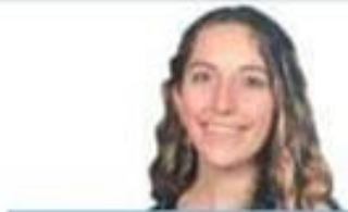
THE DAPHNE D. MARTIN

Ακολουθεί αναδημοσίευση από το άρθρο στην εφημερίδα «ΤΑ ΝΕΑ», με ημερομηνία 24.01.2022.