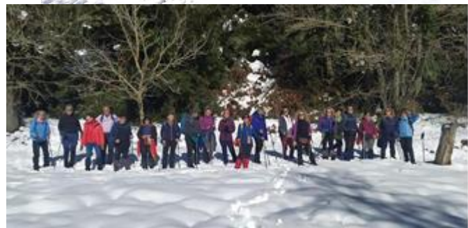
📷: «Ατραπός» και Παναγιώτης Δουζίνας